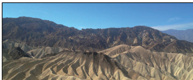
Death Valley NP